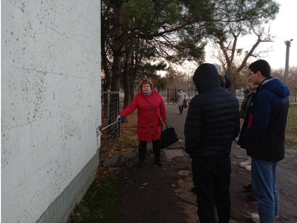
Рис. 1 Коррозия оголенной арматуры железобетонных конструкций

13.11.2021г. прошел открытый урок по МДК 01.01 Проектирование зданий и сооружений по специальности 08 02.01 «Строительство и эксплуатация зданий и сооружений» в группе СЭЗ-34.