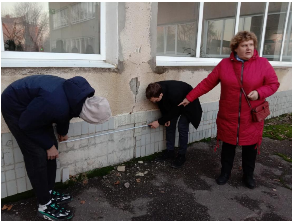
Рис. 2 Замер оголенной бетонной поверхности фундамента