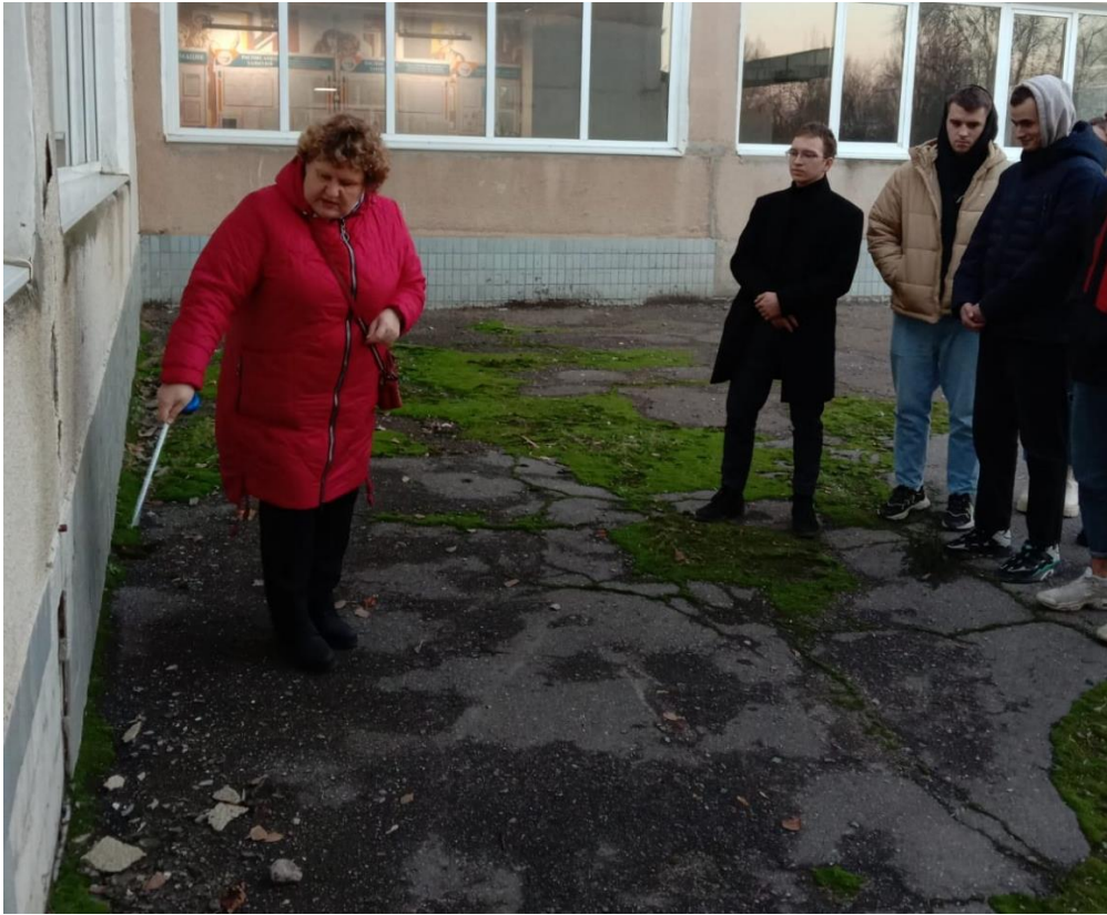
Рис. 3 Деформационные трещины фундамента